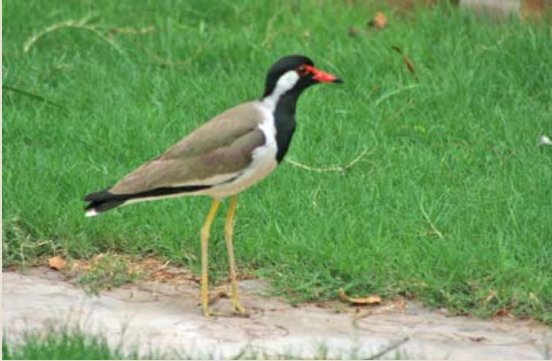
ఎర్ర జుత్తు తీతువ