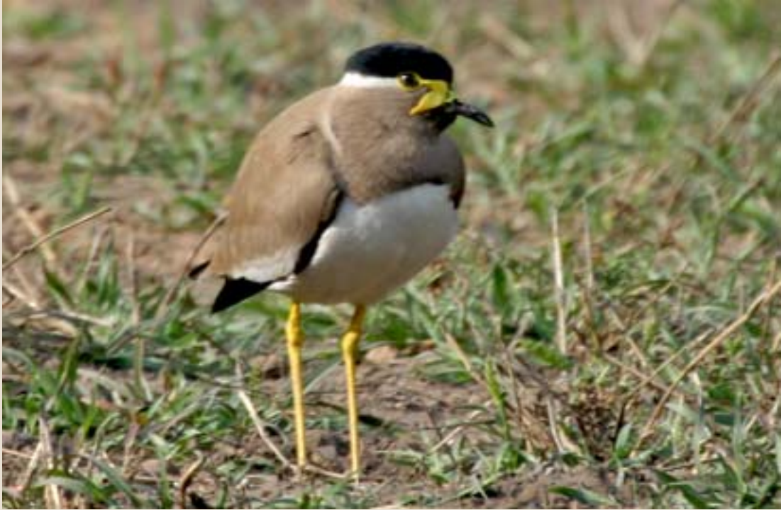
పసుపు జిత్తు తీతువ