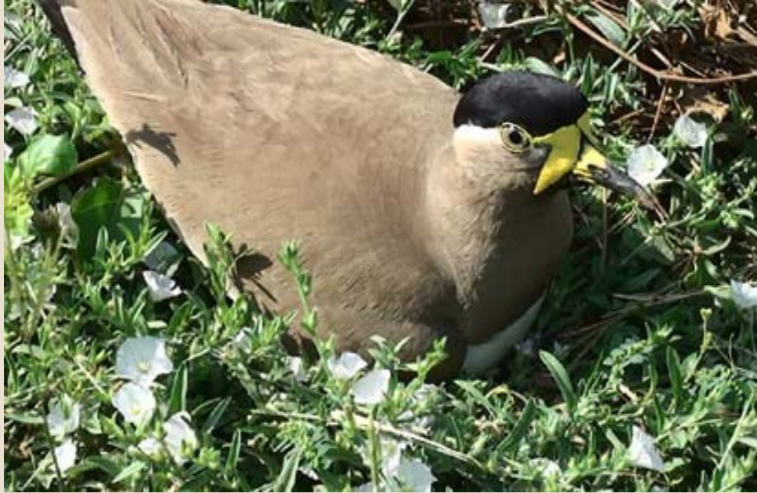
గుడ్లను పొదుగుతున్న పసుపు తీతువ