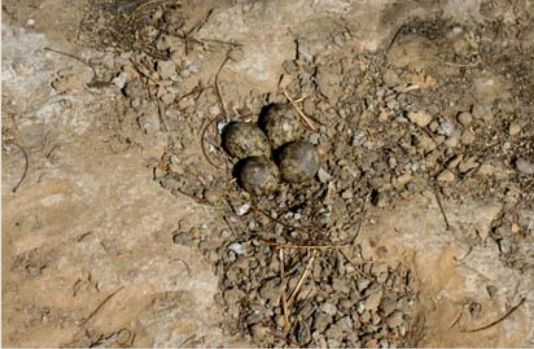
ఎర్ర తీతువ గూడు