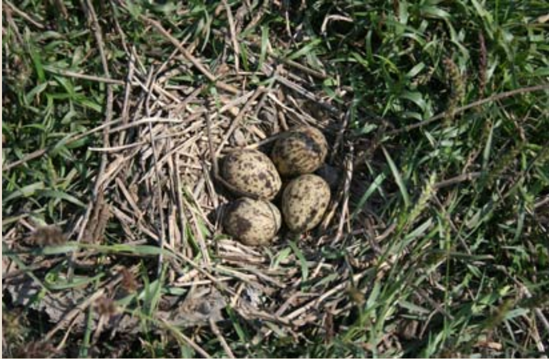
గడ్డిమధ్య పసుపు తీతువ గూడు