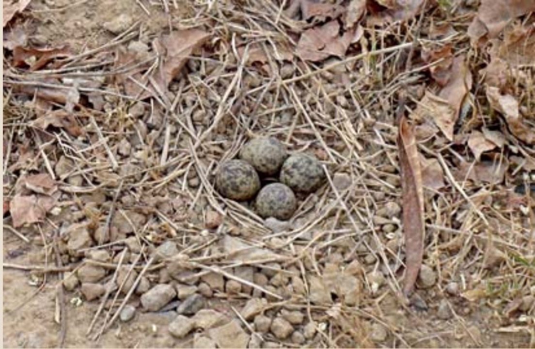
పసుపు తీతువ గూడు