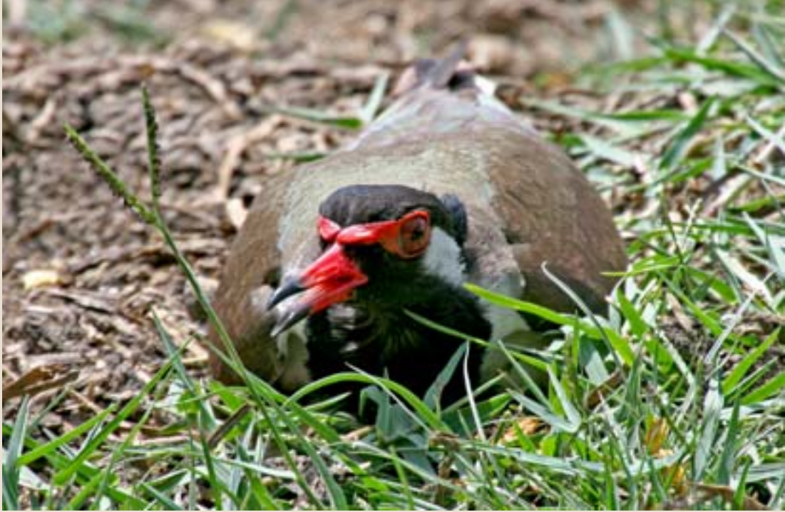
గుడ్లను పొదుగుతున్న ఎర్ర తీతువ