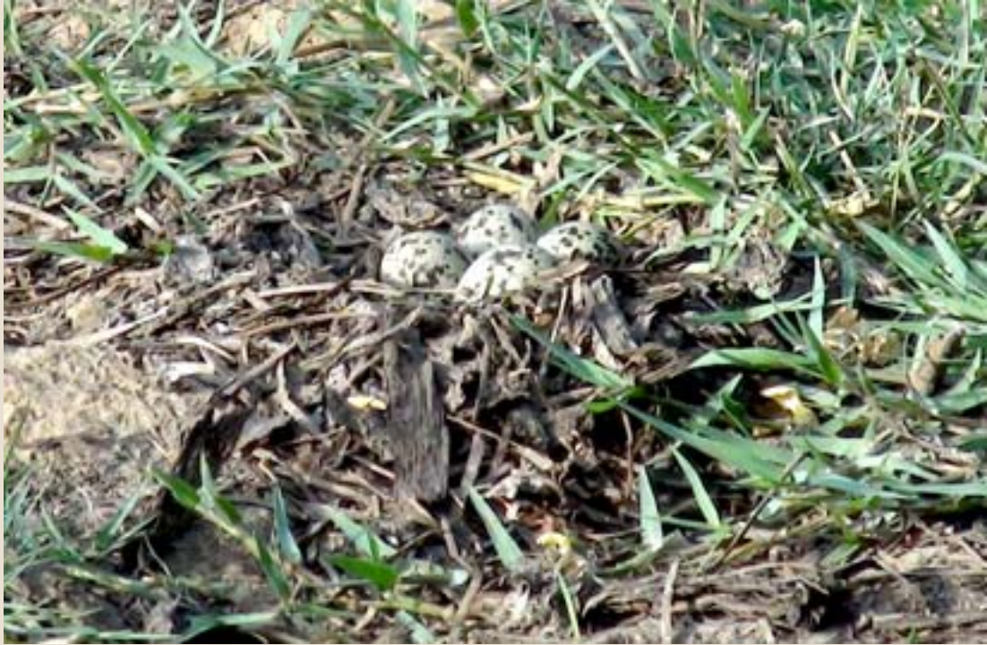
గడ్డిమధ్య ఎర్ర తీతువ గూడు