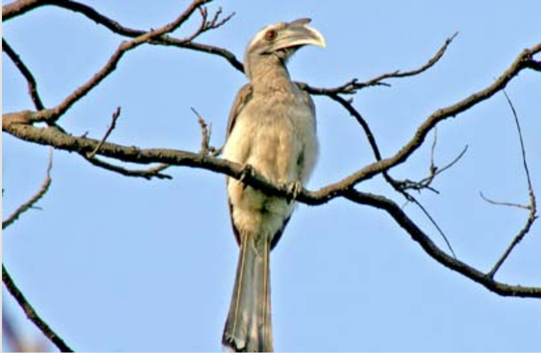
బూడిదరంగు కొమ్ము పక్షి - మగది