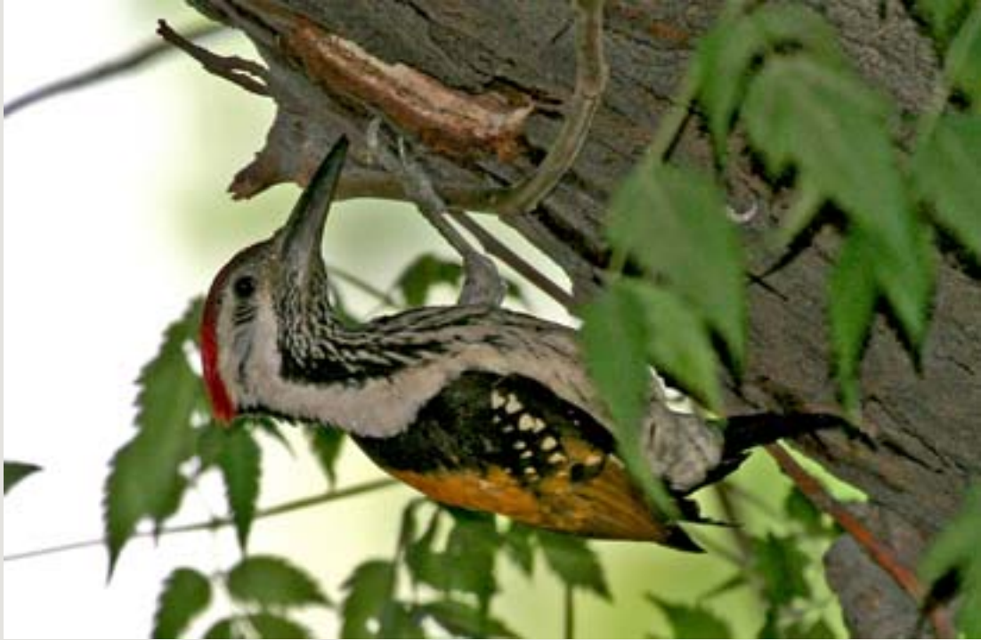
బంగారు వెన్ను వడ్రంగిపిట్ట