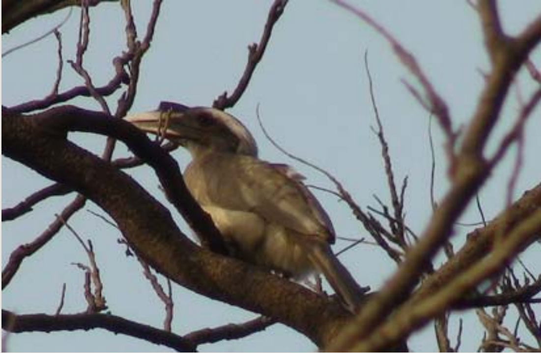
బూడిదరంగు కొమ్ము పక్షి - ఆడవి