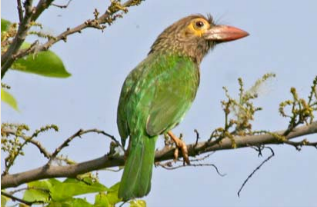
గోధుమ తల కంసాలి పిట్ట